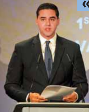
Ο υπουργός Μεταφορών και Υποδομών της Μάλτας dr Ian Borg

1 ST – 5 TH OCTOBER 2018 VALLETTA, MALTA