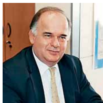
Ο εφοπλιστής Πέτρος Παππάς

Τ ον τεράστιο αντίκτυπο των νέων αυστηρότερων περιβαλλοντικών κανονισμών στη ναυτιλιακή βιομηχανία επισήμανε ο διευθύνων σύμβουλος της Star Bulk Πέτρος Παππάς, συμμετέχοντας στο πάνελ του «Capital Link 13th Annual New York Maritime Forum» που πραγματοποιήθηκε πρόσφατα στη Νέα Υόρκη. Ο Έλληνας εφοπλιστής απέδωσε συντριπτικά μεγάλο ποσοστό (80%) των μειωμένων παραγγελιών στη διάχυτη αβεβαιότητα που απορρέει από τους κανονισμούς για τα καύσιμα: «Βασικό ζήτημα που θα μας κρατήσει επί ποδός για δεκαετίες, και μας αποτρέπει από την παραγωγή νέων πλοίων, είναι ο τερματισμός των εκπομπών διοξειδίου του άνθρακα. Δεν μπορούμε αυτό να το κάνουμε μόνοι μας. Πρώτα πρέπει να ναυπηγεία να ακολουθήσουν τις αναγκαίες διαδικασίες έρευνας και ανάπτυξης, ώστε να κατασκευάζουν πλοία που θα χρησιμοποιούν το καύσιμο του μέλλοντος. Έπειτα πρέπει οι εταιρείες εφοδιασμού νέων καυσίμων να αναπτύξουν