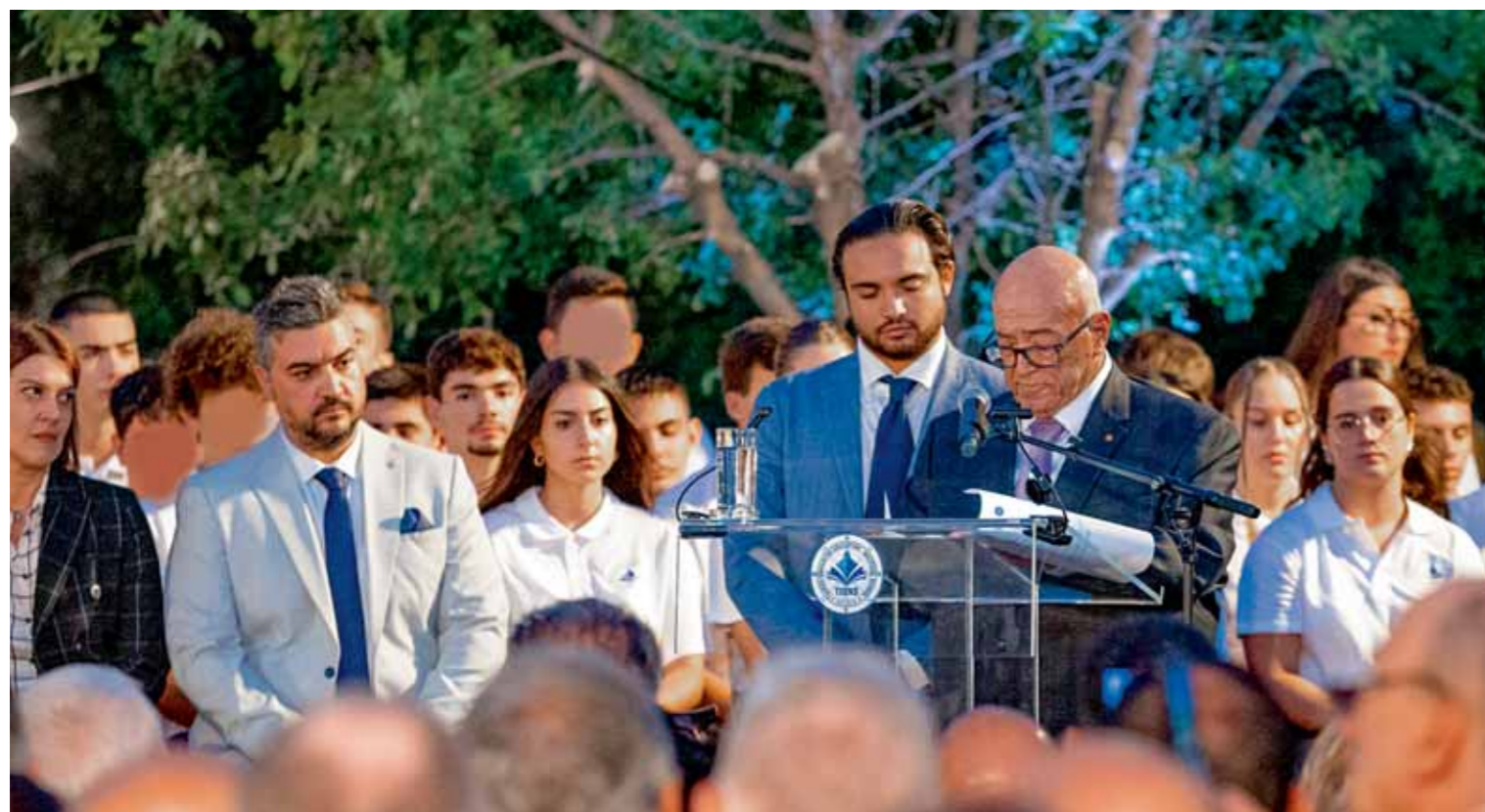
➤ ΙΔΡΥΜΑ «ΜΑΡΙΑ ΤΣΑΚΟΣ» • Στη Χίο η πρώτη ιδιωτική Ακαδημία Εμπορικού Ναυτικού • σελ. 54