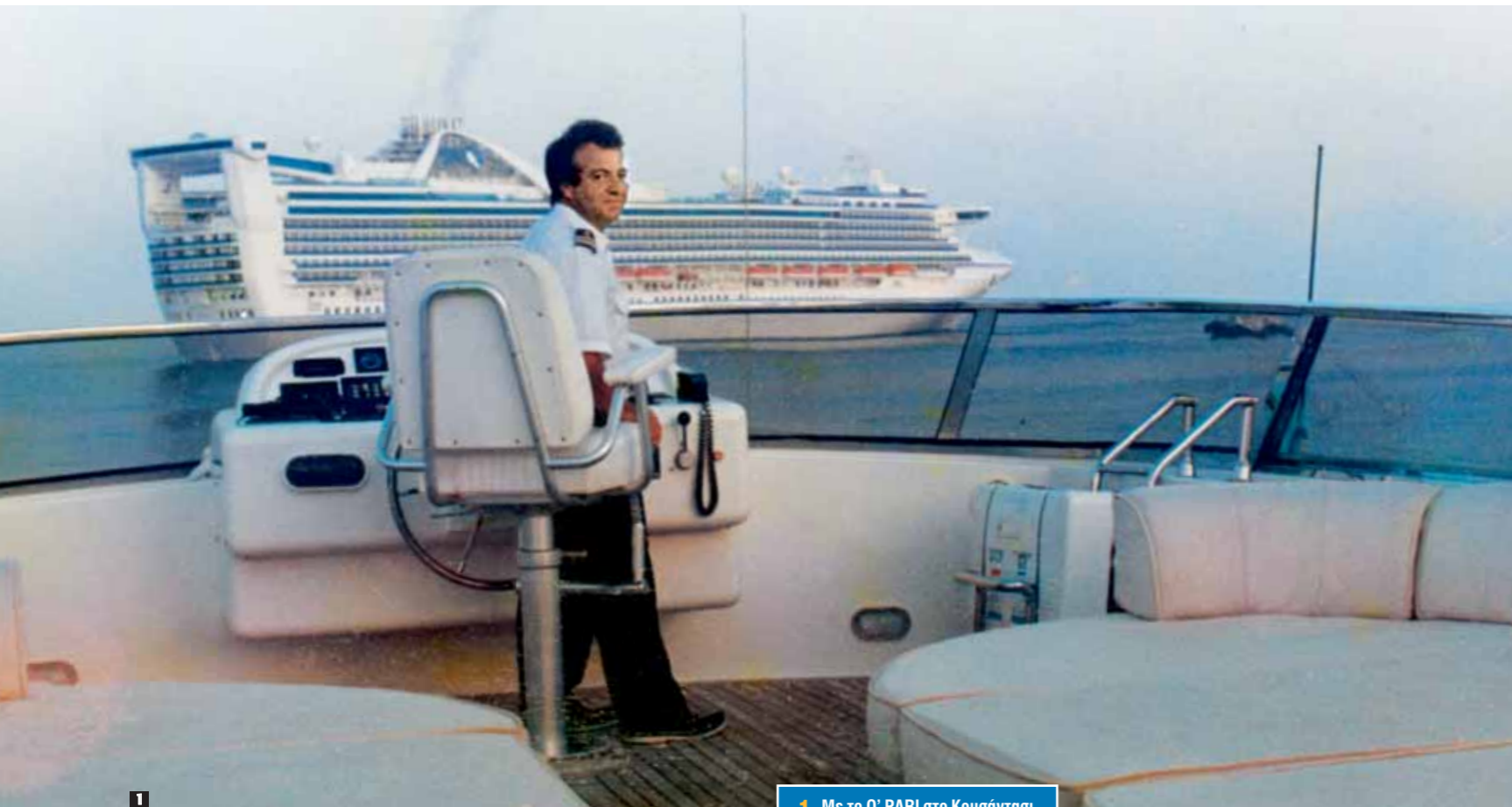
1. Με το O' PARI στο Κουσάντσαι το 1998. 2. Με το O' PARI στον Πανορμίτη της Σύμης το 1998. 3. Έξω από τη θαλαμηγό ALFA ALFA το 1993