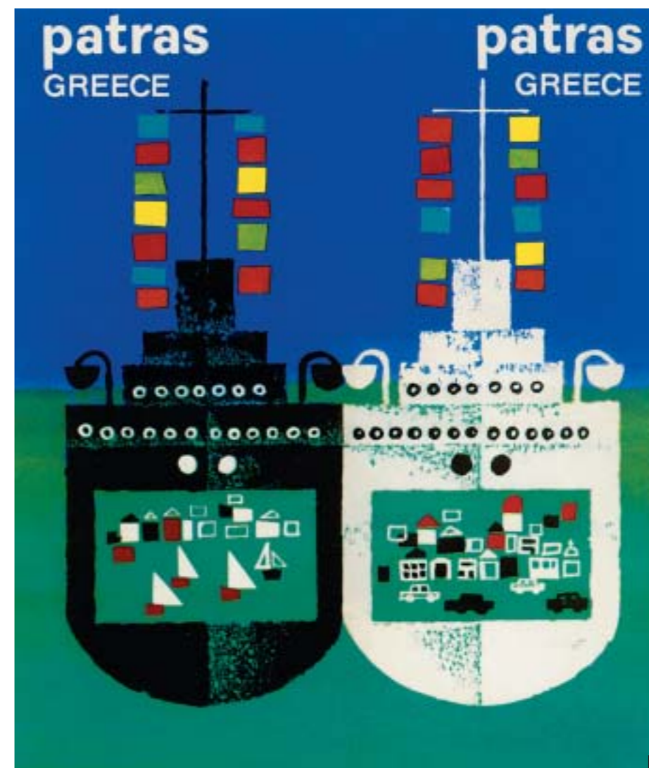
1, 2. Έντυπα του Freddie Carabott για τον ΕΟΤ το 1962 και 1963 αντίστοιχα. 3. Αφίσα του Μ. Κατζουράκη για την εταιρεία Ολυμπιακές Κρουαζιέρες το 1959. 4. Έντυπο τουριστικής εταιρείας της Λένας Σχινά