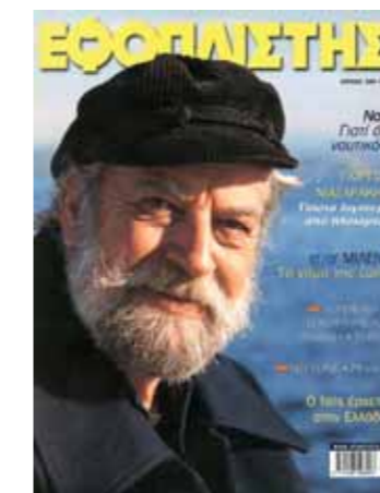
Ιστορική μορφή πλοίαρχου, σε μια ιστορική συνέντευξή του, στον «Ε» Απριλίου 2002 (τ. 108)

Φουρτούνες και βαπόρια, ζωντανά όνειρα και παραστάσεις από τη θάλασσα και τα ταξίδια του, από τη 33ετή ναυτική υπηρεσία του. Πιστός σ' αυτή τη θάλασσα μέχρι τέλους.