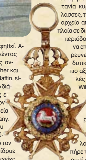
Το παράσημο Knight Commander του Sir John Franklin που βρέθηκε από τους μετέπειτα ερευνητές

λο βαθμό χαρτογραφηθεί. Από το 1670, αξιοποιώντας τις πρώιμες έρευνες ανδρών, όπως ο Frobisher και Davis, ο Hudson και Baffin, είχε ιδρυθεί με βασιλικό διάταγμα ένας σταθμός εμπορίας γούνας στον Βορρά από την εταιρεία Hudson's Bay Company. Αυτή η εταιρεία, που είχε στην κατοχή της ένα μεγάλο μέρος από τον σημερινό Καναδά, ίδρυε σταθμούς και βιοτεχνίες στις ακτές του Hudson Bay και ακολούθως κατά μήκος των μεγάλων ποταμών του Βορρά και των Βραχωδών Όρων.