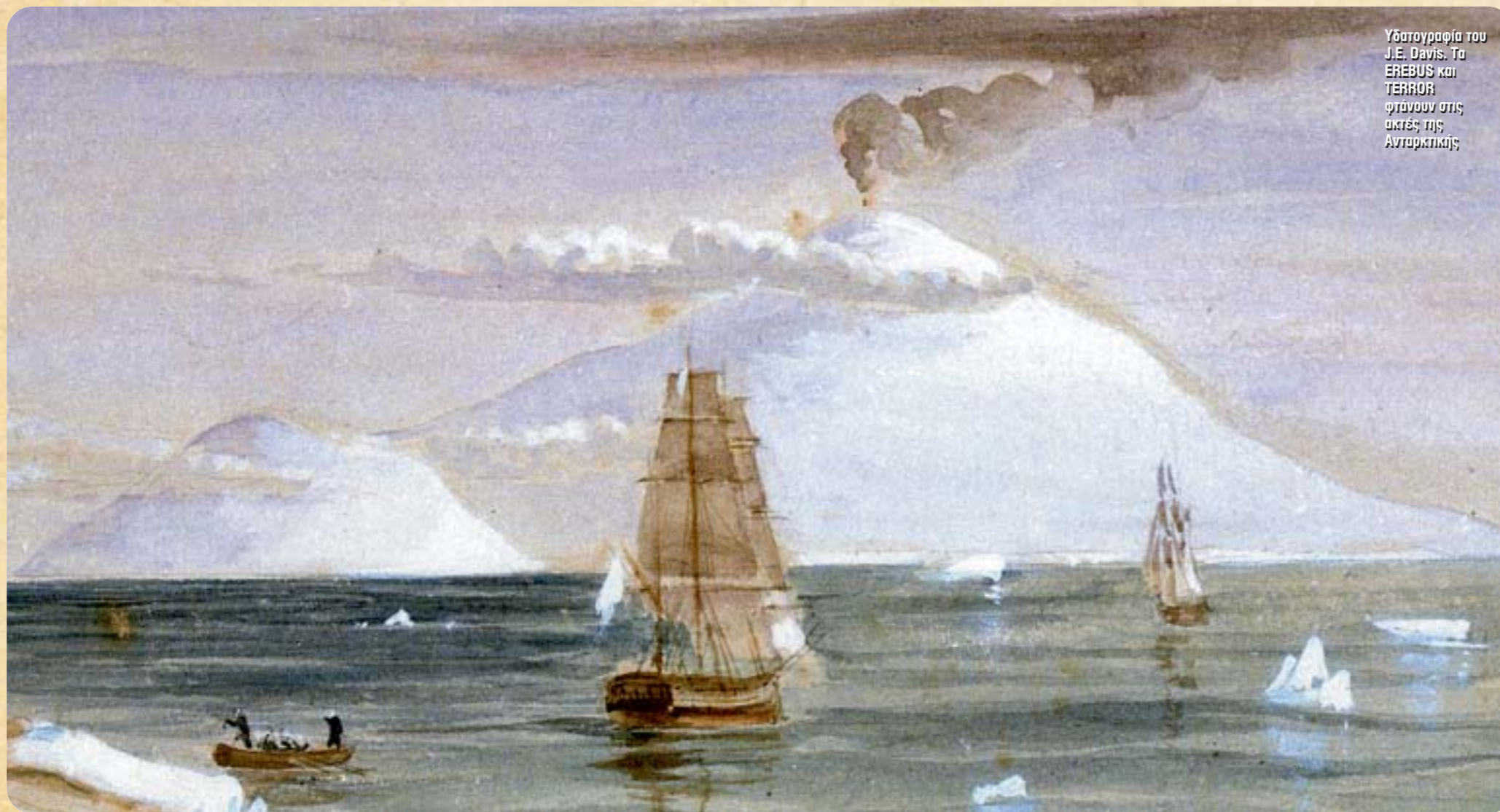
Υδατογραφία του J.E. Davis. Τα EREBUS και TERROR φτάνουν στις ακτές της Ανταρκτικής

Στην εποχή που οι εξερευνησίες και η αναζήτηση νέων θαλάσσιων δρόμων βρίσκονταν στο ζενίθ, δύο πλοία ανέλαβαν την αποστολή να ανακαλύψουν ένα νέο πέρασμα στο Αρκτικό Αρχιπέλαγος. Δυστυχώς, η προσπάθειά τους αυτή δεν στέφθηκε με επιτυχία. Την ιστορία τους επανέφερε στο προσκήνιο η πρόσφατη ανακάλυψη του HMS INVESTIGATOR, ενός πλοίου που συμμετείχε σε μία από τις αποστολές ανεύρεσης των δύο χαμένων караβιών