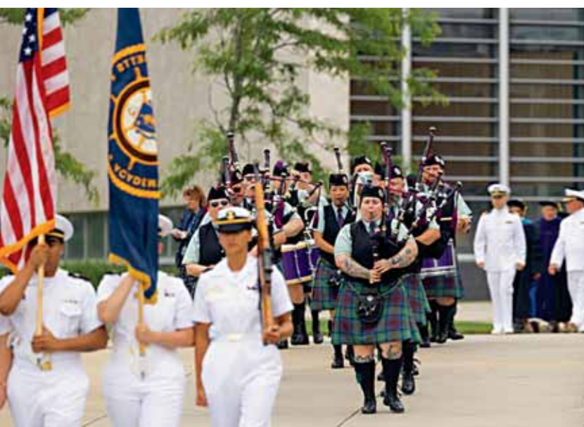
Ο ελληνικός εθνικός ύμνος παιάνισε για πρώτη φορά σε αποφοίτηση σπουδαστών της Ναυτικής Ακαδημίας Μασαχουσέτης, που μετρά ιστορία 133 ετών

στην τέχνη. Πήρατε μια σοφή απόφαση επιλέγοντας αυτή τη σταδιοδρομία. Γιατί οι θαλάσσιες μεταφορές μεταφέρουν ενέργεια, πρώτες ύλες και καταναλωτικά αγαθά σε όλο τον κόσμο. Αυτό σημαίνει πως ό,τι ονομάζουμε ανάπτυξη, εξέλιξη και παγκόσμια ευημερία εξαρτάται από τη ναυτιλία. Και εργαζόμαστε σκληρά για να κάνουμε τα πλοία πιο αποδοτικά και φιλικά προς το περιβάλλον. Για να ηγηθούμε στην πράσινη μετάβαση της ναυτιλιακής βιομηχανίας [...]. Αν έχω κάτι να μοιραστώ μαζί σας, είναι ένα μάθημα που μου δίδαξε η ζωή: Να προτιμάτε πάντα τον πιο δύσκολο δρόμο, το πιο δύσβατο μονοπάτι για να ακολουθήσετε τα όνειρά σας. Αυτό μ' έχει καθοδηγήσει στη ζωή μου, στη ναυτιλία, στον αθλητισμό, στα μέσα ενημέρωσης, στην πολιτική. Απολαμβάνω το ανηφορικό ταξίδι».