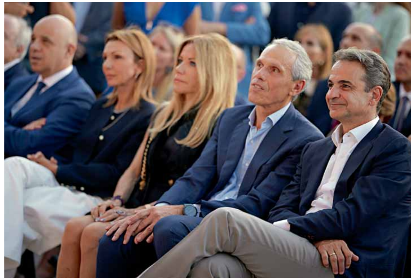
Η πρόεδρος της ΕΕΕ Μελίνα Τραυλού, η Μαριάννα Λάτση, μέλος δ.σ. του Κοινωνικού Ιδρύματος Ιωάννη Σ. Λάτση, ο διευθύνων σύμβουλος της Dimand Δημήτρης Ανδριόπουλος και ο πρωθυπουργός Κυριάκος Μητσοτάκης

«Το πιο πράσινο, το πιο φιλικό και το πιο μοντέρνο κτίριο», υπόδειγμα αρχιτεκτονικής και κατασκευαστικής μεταμόρφωσης, έχει πια εγκαινιαστεί, λειτουργεί και ακτινοβολεί σε όλο το λιμάνι του Πειραιά. Η αρχή μιας νέας εποχής