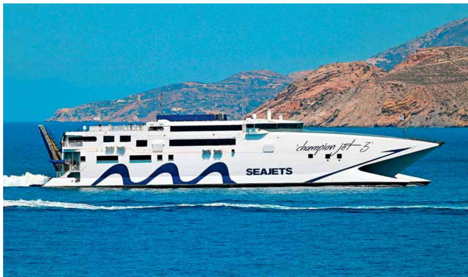
➤ CHAMPION JET 3 • SEAJETS • Στις Κυκλάδες σελ. 62