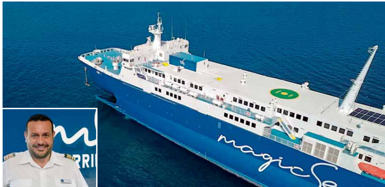
➔ CAT I • Στις Σποράδες • Magic Sea Ferries σελ. 84