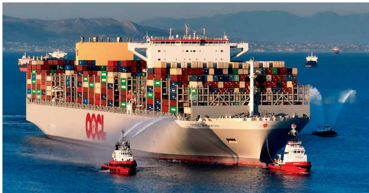
➤ OOCL PIRAEUS • COSCO • PCT • Το mega containership «γιόρτασε» τον Πειραιά • σελ. 34