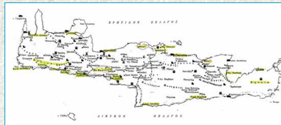
Σούγια, Αγία Ρουμέλη, Αγία Πελαγία, Φόδελε, Πρέβελη, Μπαλί, Λουτρό, Κριού Μέτωπο: τα σημεία της κρητικής ακτογραμμής που προσέγγιζαν συνήθως τα ελληνικά καταδρομικά