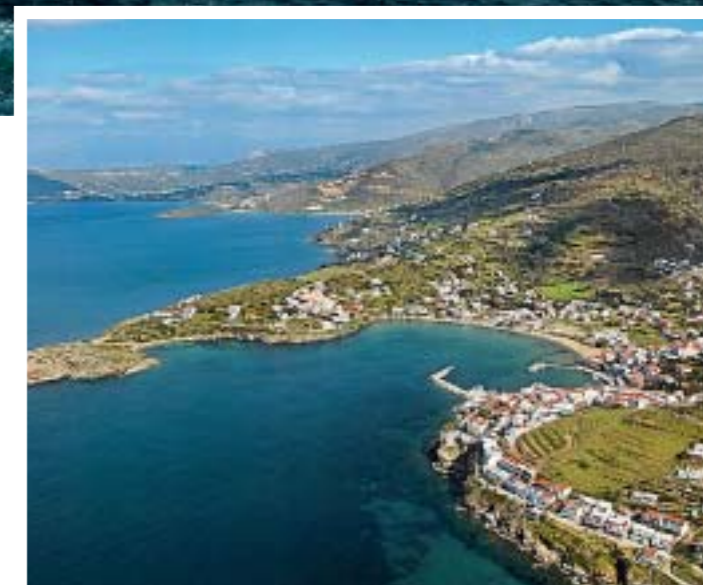
Το Μπασι και στο βάθος το Γαύριο

ναυτοσύνη στο νησί, εξάλλου, αλλά και για την ιδιαίτερη μορφή της Ανδριώτισσας γυναίκας και μάνας, ο κ. Ανωμερίτης γράφει χαρακτηριστικά: «Κατεβαίνοντας στο λιμάνι, η καταμέτρηση όσων γυρνάνε από ταξίδια κι οι αγκαλιές για εκείνους που φεύγουν. Μία κοινωνία γυναικοκρατούμενη και στερρημένη, μία κοινωνία που δεν ήθελε τους ξένους, παρότι άνθρωποι και κοινωνία ήταν πάντοτε φιλόξενοι. ➤