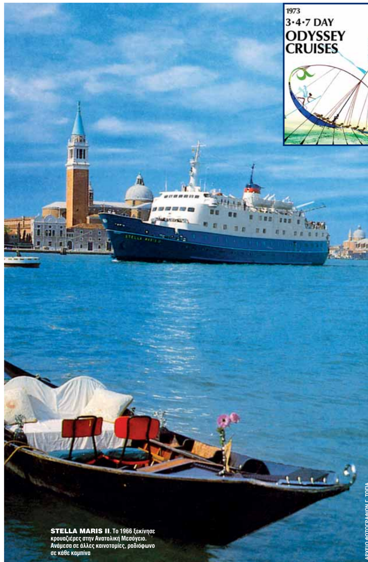
STELLA MARIS II. Το 1966 ξεκίνησε κρουαζιέρες στην Ανατολική Μεσόγειο. Ανάμεσα σε άλλες καινοτομίες, ραδιόφωνο σε κάθε καμπίνα

Το πρώτο πλοίο της Sun Line λανσαρίστηκε το 1958. Ήταν μια καναδική κορβέτα κλάσης Castle, η οποία ξεκίνησε να ναυπηγείται το 1943 ως HMS GUILDFORD CASTLE (K378) και αμέσως μετά την ολοκλήρωσή της παραδόθηκε στο καναδικό Ναυτικό και υπηρέτησε στον Βόρειο Ατλαντικό ως HMCS HESPELER (K 489). Μετά τη λήξη του πολέμου, το πλοίο πουλήθηκε στην Union Steamship, μετονομάστηκε σε CHILCOTIN και χρησιμοποιήθηκε σε κρουαζιέρες Βανκούβερ-Αλάσκα. Όταν αποκτήθηκε από τη Sun Line, έπλευσε σε ναυπηγείο της Τεργέστης, δέχτη-