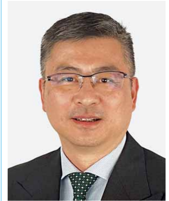
Ο διευθύνων σύμβουλος της ΟΛΠ Α.Ε. Σου Σουντόνγκ

Έκλεισε τα δέκα χρόνια η Cosco στο λιμάνι του Πειραιά και σταχυολογεί τις επιτυχίες της. Θετικά οικονομικά αποτελέσματα καταγράφηκαν και το 2025, παρά τις αναταράξεις που το σημάδεψαν. Οι δυνατοί τομείς και η υψηλή ανθεκτικότητα στις προκλήσεις