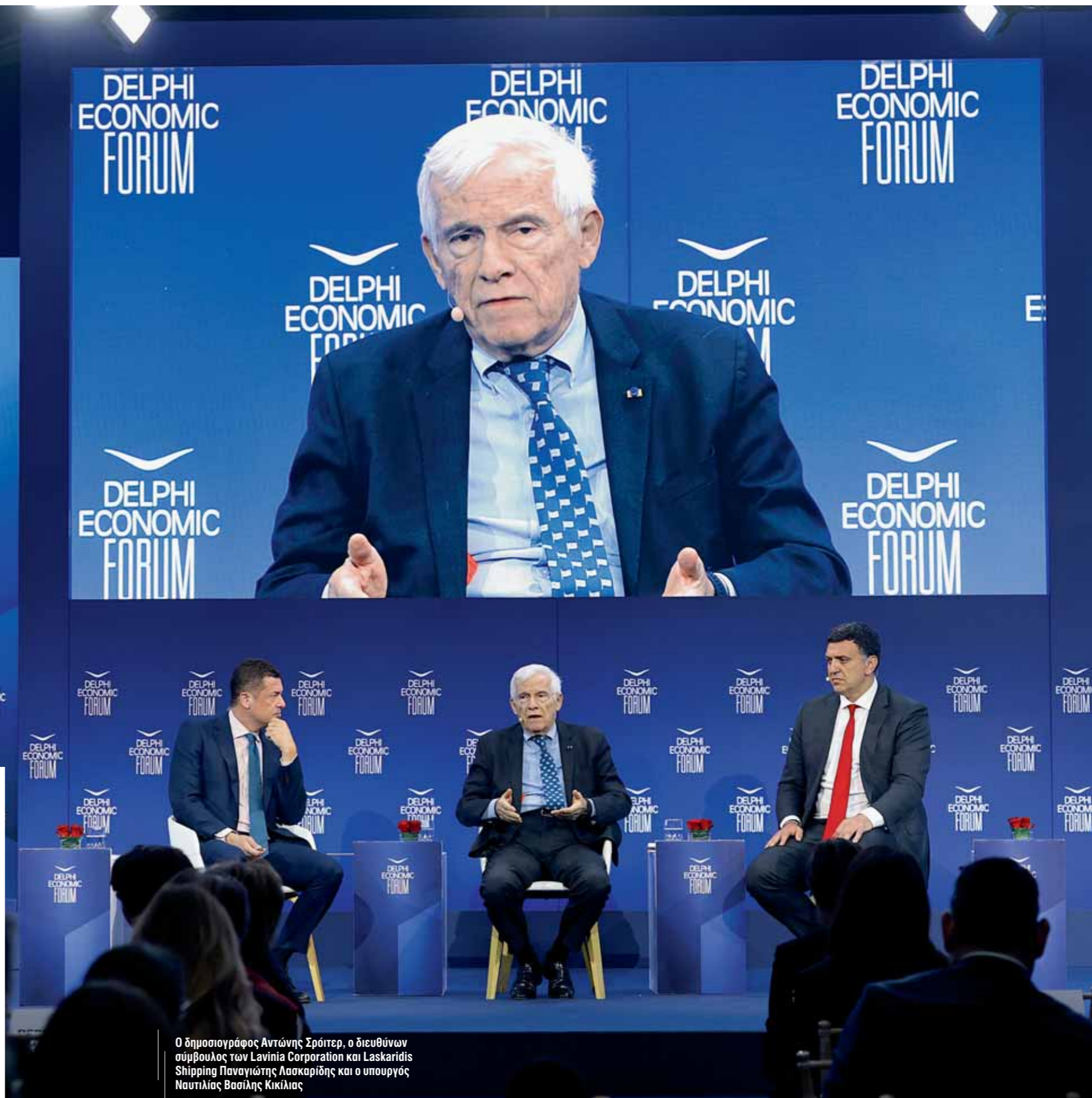
Ο δημοσιογράφος Αντώνης Σρόιτερ, ο διευθύνων σύμβουλος των Lavinia Corporation και Laskaridis Shipping Παναγιώτης Λασκαρίδης και ο υπουργός Ναυτιλίας Βασίλης Κικίλιας