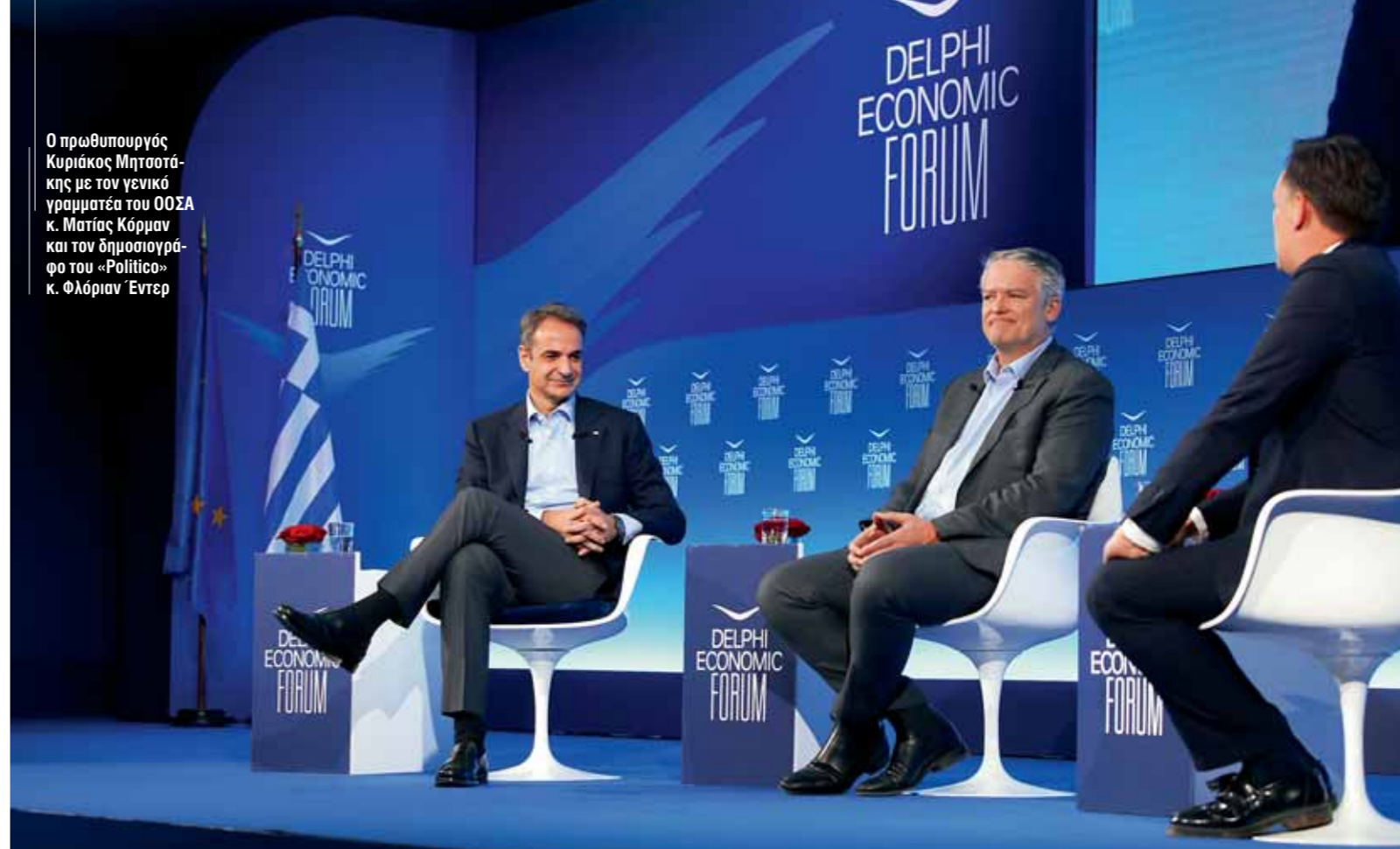
Ο πρωθυπουργός Κυριάκος Μητσοτάκης με τον γενικό γραμματέα του ΟΟΣΑ κ. Μάτιας Κάρμαν και τον δημοσιογράφο του «Politico» κ. Φλόριαν Έντερ

θα δούμε δυσάρεστες καταστάσεις για την ευρωπαϊκή ναυτιλία. Η ελληνόκτητη ναυτιλία προφανώς θα συνεχίσει να υπάρχει, το ζητούμενο είναι αν θα υπάρχει στην Ελλάδα. Πρέπει να εξασφαλίσουμε ένα πλαίσιο που θα επιτρέπει την παρουσία μας στην πατρίδα μας». Και ως κατακλείδα: «Η ναυτιλία πρέπει να γίνει εξωστρεφής και όχι να σχολιάζει τις απόψεις των άλλων. Τις δικές μας απόψεις πρέπει να προβάλλουμε».