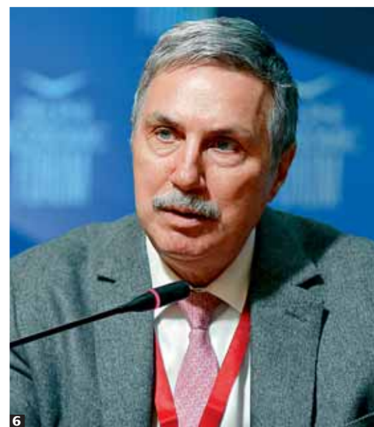
1. Ο διευθύνων σύμβουλος των εταιρειών Lavinia Corporation και Laskaridis Shipping κ. Πάνος Λασκαρίδης. 2. Η διευθύνουσα σύμβουλος της Diana Shipping και πρόεδρος της Helmera κυρία Σεμίραμις Παληού. 3. Η Πρόεδρος της Δημοκρατίας κυρία Κατερίνα Σακελλαροπούλου. 4. Ο διευθύνων σύμβουλος της Seenergy Maritime κ. Σταμάτης Τσαντάνης. 5. Ο γενικός διεθυντής της Eastern Mediterranean κ. Θανάσης Μαρτίνος. 6. Ο πρόεδρος του Κοινοφελούς Ιδρύματος «Αλέξανδρος Σ. Ωνάσης» κ. Αντώνης Παπαδημητρίου