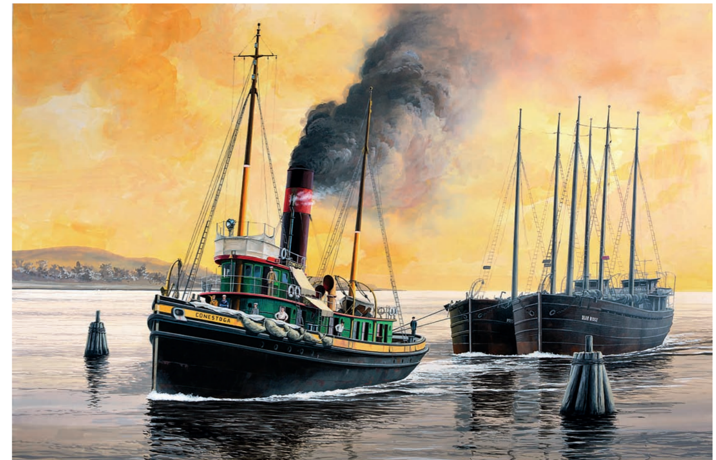
USS CONESTOGA. Κατά τα πρώτα του χρόνια, όταν είχε ναυπηγηθεί για τη Philadelphia & Reading Railroad Company και μετέφερε μπάριτζες με κάρβουνο. Έργο του Danijel Frka

αποστολές στον Ειρηνικό Ωκεανό. Θα βρεθεί στο Σαν Ντιέγκο και στο Mare Island, απ' όπου θα αναχωρήσει στις 25 Μαρτίου 1921 ▶