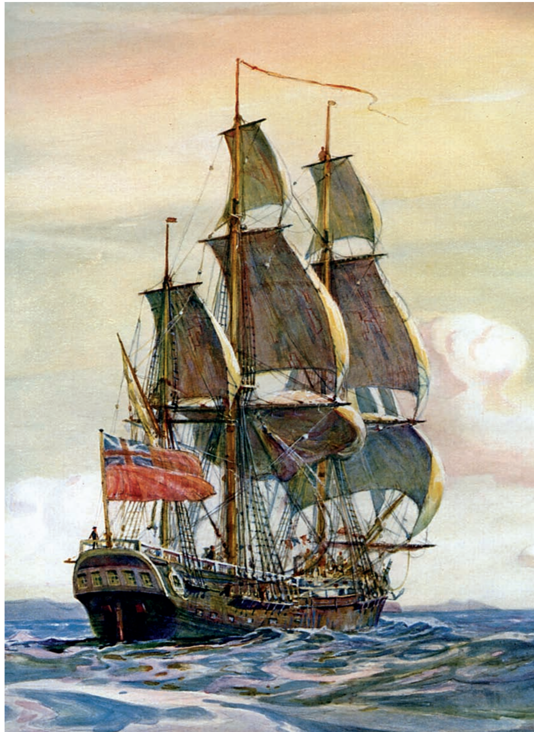
HMS ENDEAVOUR. Το καράβι με το οποίο ο πλοίαρχος Τζέιμς Κουκ πραγματοποίησε την πρώτη αποστολή του, την τριετία 1768-1771. Πίνακας του Gregory Robinson

Σε βάθος εξήντα μέτρων, περίπου τριάντα ναυτικά μίλια δυτι-