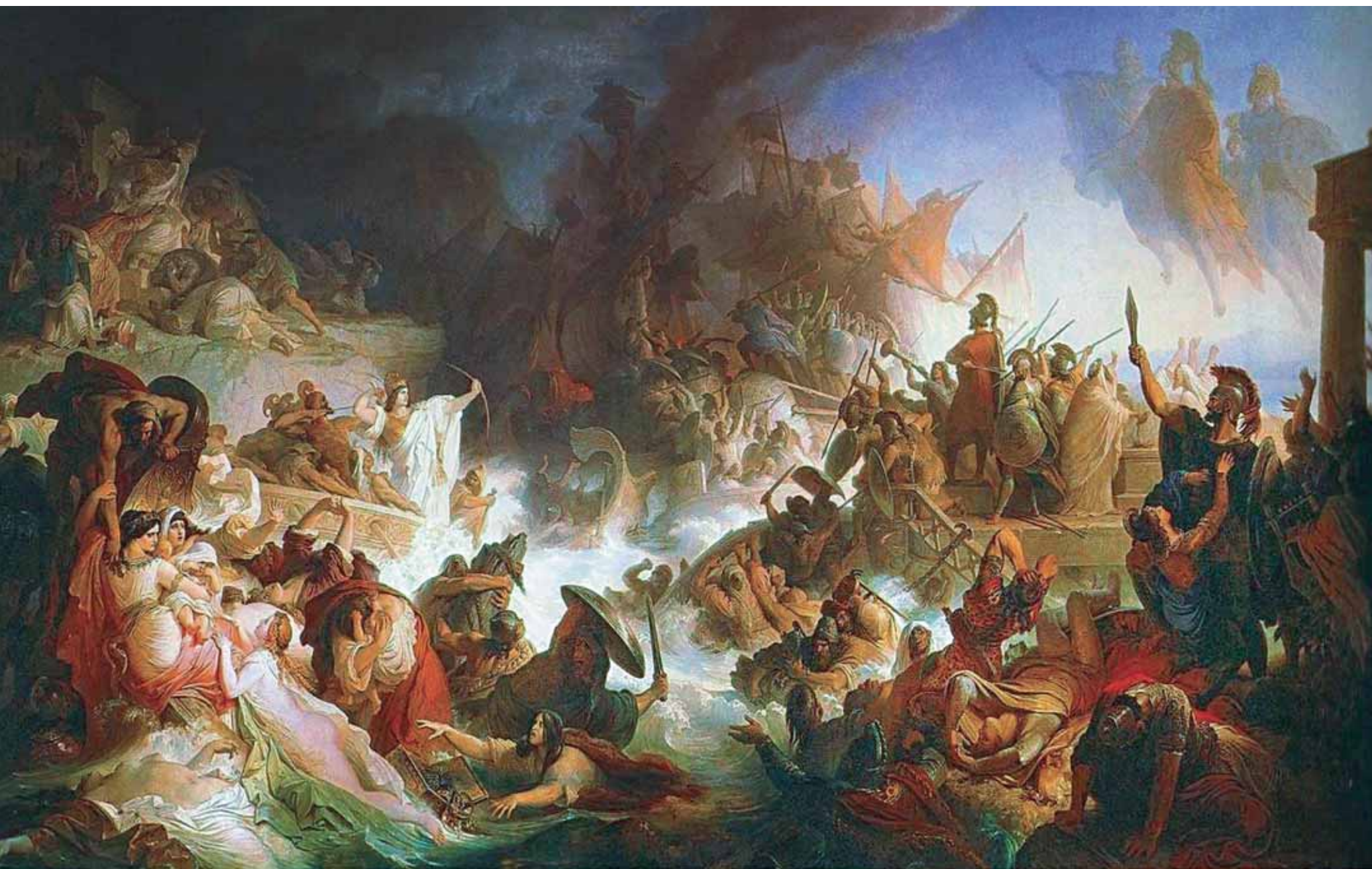
Βίλχελμ φον Κάουλμπαχ, «Η Ναυμαχία της Σαλαμίνας» (1862/64). Λάδι σε καμβά, περ. 500 x 900 εκ. Μόναχο, Βαυαρικό Κοινοβούλιο (Maximilianeum)