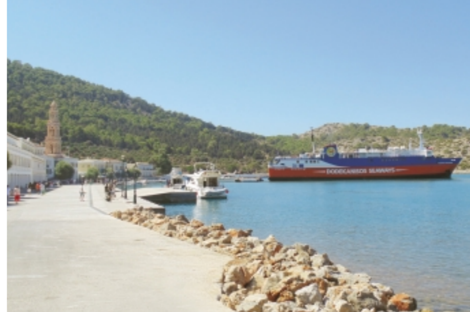
ΕΓ/ΟΓ ΠΑΝΑΓΙΑ ΣΚΙΑΔΕΝΗ. Στη Σύμη, στην Ιερά Μονή του Ταξιάρχη Μιχαήλ Πανορμίτη.