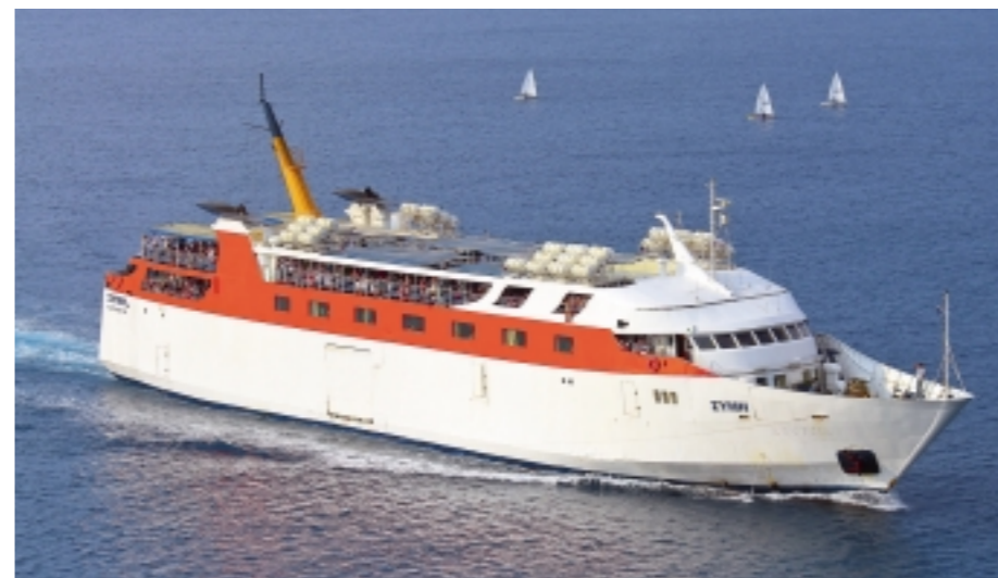
ΣΤΗ ΡΟΔΟ. Το ΣΥΜΗ φτάνοντας στο λιμάνι.