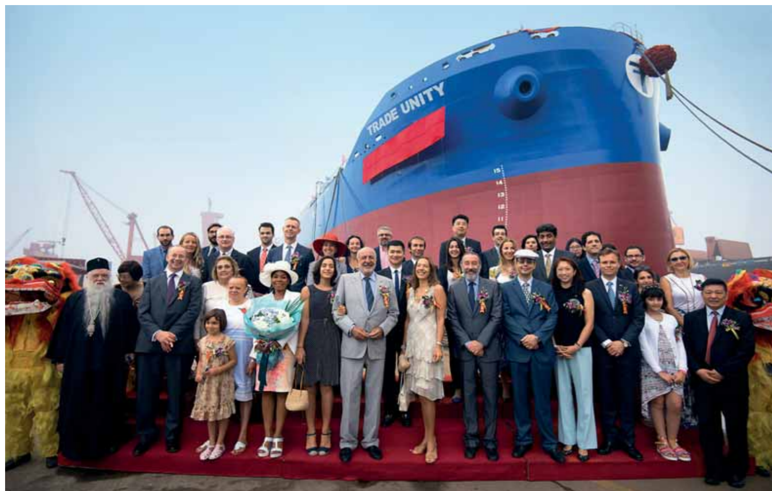
➤ Όμιλος Καλλιμανόπουλου • Διπλή γιορτή στην Άπω Ανατολή σελ. 34